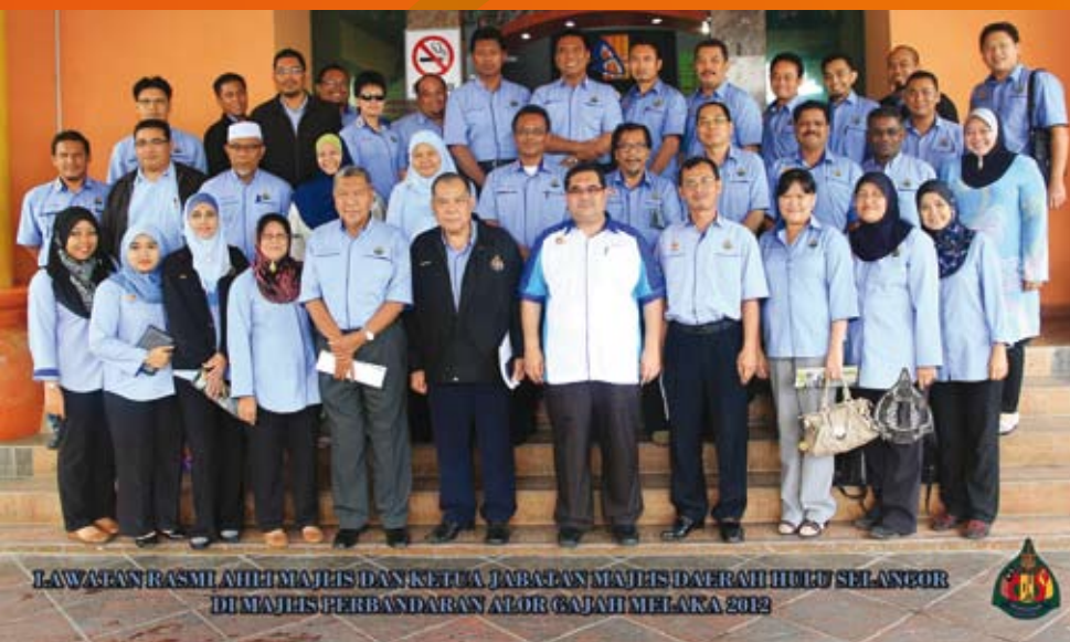
LAWATAN RASMI AHLI MAJLIS DAN KETUA JABATAN MAJLIS DAERAH HULU SELANGOR DI MAJLIS PERBANDARAN ALOR GAJAH MELAKA 2012